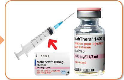
3. Coller l'étiquette autocollante sur la seringue

Nous vous rappelons que tout effet indésirable doit être déclaré au Centre régional de pharmacovigilance (CRPV) dont vous dépendez (coordonnées disponibles sur le site Internet de l'ANSM www.ansm.sante.fr ou dans le Dictionnaire Vidal®).