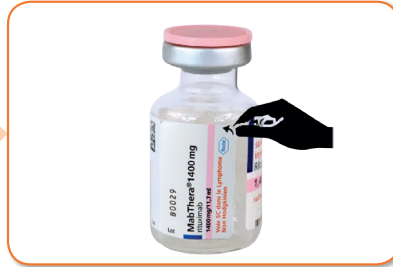
2. Détacher l'étiquette autocollante