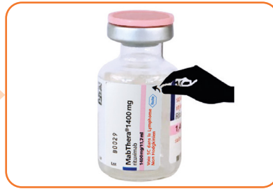
2. Détacher l'étiquette autocollante