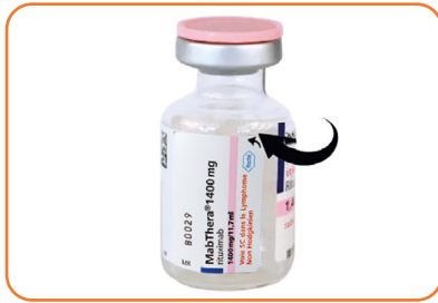
1. L'étiquette du flacon MabThera® 1400 mg dispose d'une partie détachable

MabThera® 1 400 mg, solution pour injection sous-cutanée Pour utilisation dans les lymphomes non hodgkiniens UNIQUEMENT